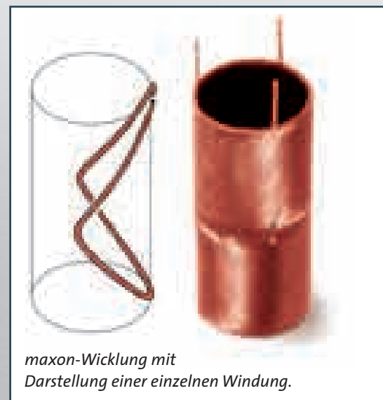
maxon-Wicklung mit Darstellung einer einzelnen Windung.

Das mikrotechnische Antriebssystem, bestehend aus einem bürstenlosen EC-Motor, einem Magnet-Encoder und einem spielfreien Harmonic-Drive-Getriebe ist ein Meilenstein auf dem Weg zu Bewegungen von aller kleinsten Komponenten. Der Motor misst 6 mm im Durchmesser, das Getriebe 8 mm und die Einheit leistet dauernd über 1.2 Watt. Dank dem spiel-