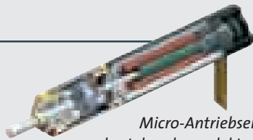
Micro-Antriebseinheit, bestehend aus elektronisch kommutiertem EC-Kleinstmotor und Planetengetriebe. Durchmesser 6 mm.