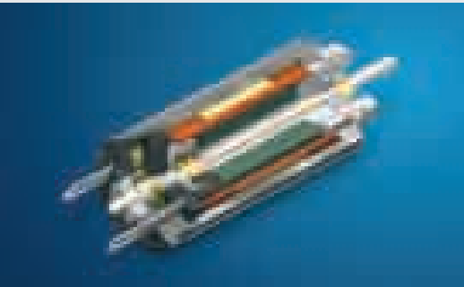
Keramikwelle Gleichstrommotor von der Größe einer Bleistiftspitze. maxon DC motor RE 8 Ø8 mm, Edelmetallbürsten (0,5 W).

tungselektronik oder durch aufwändiges Tuning aufgefangen werden und die Positioniergenauigkeit des Motors wird durch die Auflösung des Encoders bestimmt. Die Verwendung von Hall-Sensoren zur Lagemeldung des Rotors erlaubt eine optimale Bestromung der Wicklung und ergibt das typische Verhalten eines Nebenschluss-Gleichstrommotors: Lineare Kennlinien der Drehzahl und des Stroms, sowie maximales Drehmoment bei Start und Stopp. Im Gegensatz etwa zur sensorlosen Kommutierung, ist der Motor auch bei kleinen Drehzahlen und im Stillstand präzise geregelt, ein Muss für Positioniersysteme.