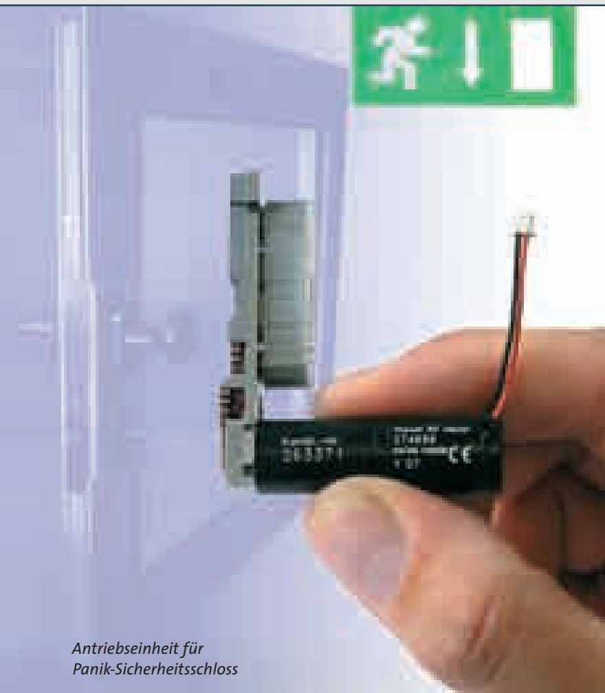
Antriebseinheit für Panik-Sicherheitsschloss