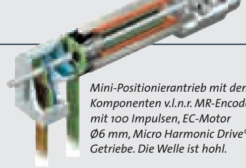
Mini-Positionierantrieb mit den Komponenten v.l.n.r. MR-Encoder mit 100 Impulsen, EC-Motor Ø6 mm, Micro Harmonic Drive® Getriebe. Die Welle ist hohl.