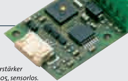
1-Q-EC Verstärker DECS 5/0.05, sensorlos.